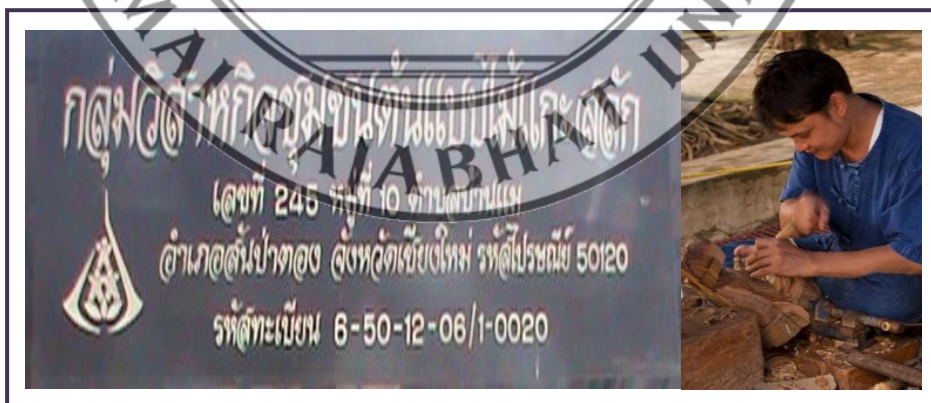
ภาพที่ 5.4 กลุ่มวิสาหกิจชุมชนต้นแบบไม้แกะสลักที่เปิดสอนงานหัตถกรรมให้แก่เยาวชนภายในชุมชนและผู้สนใจทั่วไป