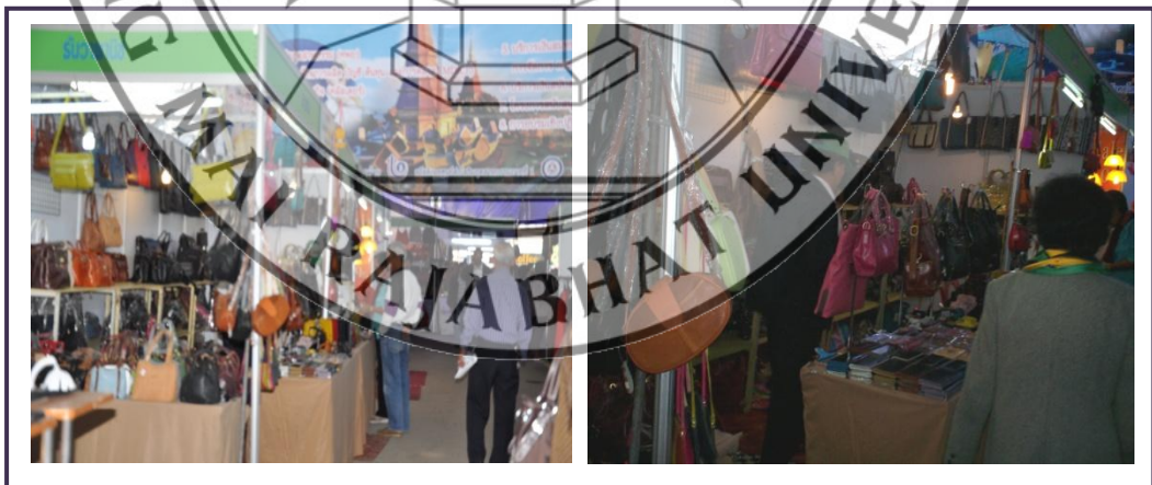
ภาพที่ 5.6 การจำหน่ายผลิตภัณฑ์หัตถกรรมภายในงานอุตสาหกรรมแฟร์ ครั้งที่ 12 ณ ศูนย์ส่งเสริมอุตสาหกรรมภาคที่ 1 จังหวัดเชียงใหม่

4) หน่วยงานของจังหวัดหรือท้องถิ่นทั้งภาครัฐและเอกชนส่งเสริมฟื้นฟูการจัดงานเกี่ยวกับผลิตภัณฑ์หัตถกรรมต่าง ๆ ขึ้น โดยภายในงานมีกิจกรรมการสาธิตวิธีการผลิตผลิตภัณฑ์จากสลาผู้มีความรู้และความชำนาญด้านงานหัตถกรรมสาขาต่าง ๆ ตลอดจนการจัดจำหน่ายผลิตภัณฑ์หัตถกรรม ทั้งนี้เพื่อเป็นการปลูกจิตสำนึกให้ผู้บริโภคเห็นคุณค่าของงานหัตถกรรม เช่น ศูนย์ส่งเสริมอุตสาหกรรมภาคที่ 1 จังหวัดเชียงใหม่ ที่ได้จัดงานอุตสาหกรรมแฟร์ขึ้น โดยกิจกรรมภายในงานมีการจำหน่ายสินค้าหัตถกรรมเช่น สิ่งทอ เครื่องหนัง เซรามิค ฯลฯ เป็นต้น