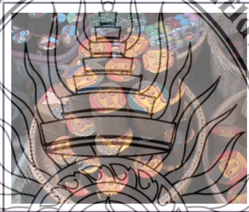
ภาพที่ 5.3 ตลับใส่ของที่นิยมทำในช่วงเทศกาล

5) ผู้ประกอบการหัตถกรรมสาขาไม้แกะสลักดำเนินธุรกิจแบบเน้นการกระจายความเสี่ยงจากการมีผลิตภัณฑ์ที่หลากหลาย จำนวน 1 ราย (41-60%) โดยในเรื่องของวัตถุดิบหลักถ้าภายในชุมชนขาดแคลนขึ้นมา ผู้ประกอบการก็จะสั่งซื้อจากอำเภอหางดง อำเภอแม่วาง เป็นต้น และในช่วงของเทศกาลก็จะมีการผลิตสินค้าที่มีขนาดเล็ก ๆ สามารถนำเดินทางไปด้วยได้ เช่น ตลับใส่ของ เป็นต้น