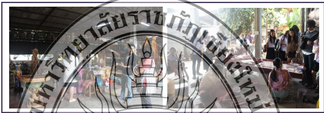
ภาพที่ 5.5 นักศึกษาสาขาวิชาศิลปกรรม มหาวิทยาลัยราชภัฏเชียงใหม่ เรียนรู้และฝึกปฏิบัติงานหัตถกรรมที่บ้านถวาย อ.หางดง จ.เชียงใหม่

3) สนับสนุนให้ภาคการศึกษามีการจัดทำหลักสูตรท้องถิ่นงานหัตถกรรมบรรจุไว้ในหลักสูตรการเรียน ทั้งนี้เพื่อเป็นการปลูกฝังความรู้ด้านงานหัตถกรรมให้แก่ นักเรียน นักศึกษาได้นำความรู้ที่ได้รับนั้นมาเป็นแนวทางในการประกอบอาชีพและสืบทอดงานหัตถกรรมสาขาต่าง ๆ สืบต่อไป