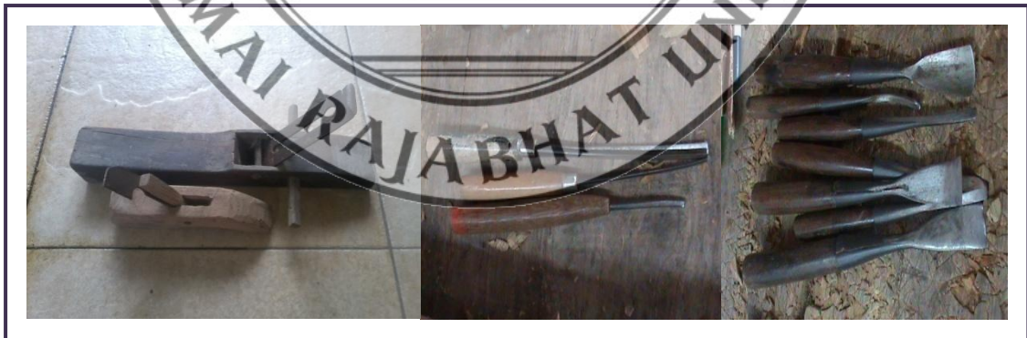
ภาพที่ 5.1 กบไสไม้และส่วประเภทต่าง ๆ

1) ผู้ประกอบการหัตถกรรมสาขาไม้แกะสลักเลือกใช้เทคโนโลยีที่เหมาะสม นั่นคือใช้เทคโนโลยีที่มีราคาไม่แพง แต่ถูกหลักวิชาการ จำนวน 8 ราย (3 ราย = 41-60% และ 5 ราย = 61-80%) โดยเครื่องมือที่ใช้ในงานแกะสลักไม้ที่คิดค้นมาจากภูมิปัญญาชาวบ้าน ได้แก่ กบไสไม้ เป็นเครื่องมือขุดผิวไม้ให้ผิวเรียบและได้รูปทรงตามต้องการ หรือส่วขนาดต่าง ๆ ที่ใช้สำหรับดอกเจาะ สลัก เฆาะ ดุน แร เป็นต้น