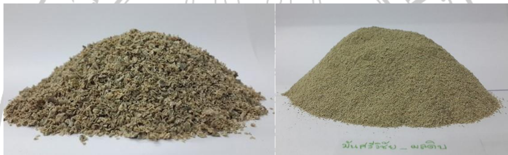
ภาพภาคผนวกที่ 9 : เปลือกมะม่วงพันธุ์มันศรีวิชัยดิบแห้ง และ ผงเปลือกมะม่วงพันธุ์มันศรีวิชัยดิบ