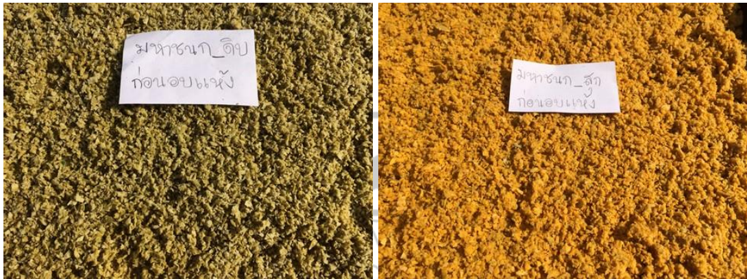
ภาพภาคผนวกที่ 5 : เปลือกมะม่วงมหาชนกผลดิบหลังการสกัด ก่อนการทำแห้ง (ซ้าย), เปลือกมะม่วงมหาชนกผลสุกหลังการสกัด ก่อนการทำแห้ง (ขวา)