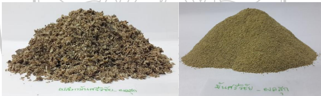
ภาพภาคผนวกที่ 10 : เปลือกมะม่วงพันธุ์มันศรีวิชัยสุกแห้ง และ ผงเปลือกมะม่วงพันธุ์มันศรีวิชัยสุก