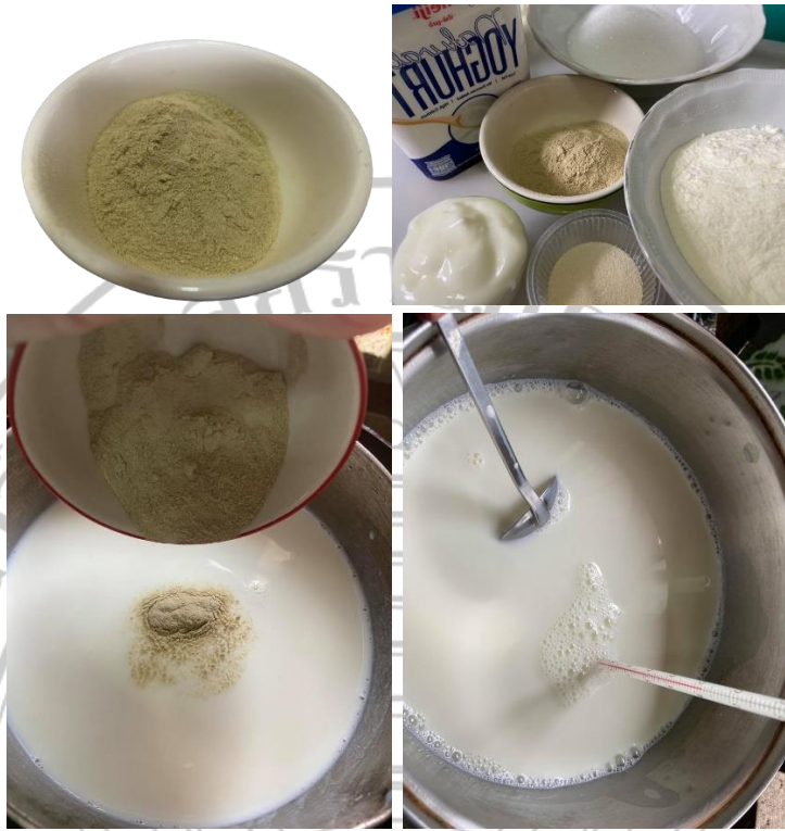
ภาพภาคผนวกที่ 13 : ส่วนผสมที่ใช้ในการทำโยเกิร์ตเสริมใยอาหารที่สกัดจากเปลือกมะม่วง