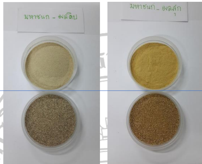
ภาพภาคผนวกที่ 11 : ผงเปลือกมะม่วงพันธุ์มหาชนกที่ผ่านตะแกรงร่อน 2 ขนาด