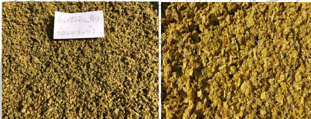
ภาพภาคผนวกที่ 6 : เปลือกมะม่วงพันธุ์มันศรีวิชัยผลดิบหลังการสกัด ก่อนการทำแห้ง (ซ้าย), เปลือกมะม่วงพันธุ์มันศรีวิชัยผลสุกหลังการสกัด ก่อนการทำแห้ง (ขวา)