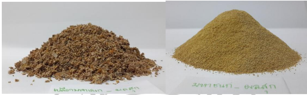
ภาพภาคผนวกที่ 8 : เปลือกมะม่วงพันธุ์มหาชนกผลสุกแห้ง และ ผงเปลือกมะม่วงพันธุ์มหาชนกสุก