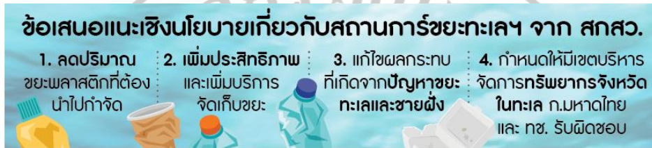
ภาพที่ 1.2 ข้อเสนอแนะเชิงนโยบายเกี่ยวกับสถานการณ์ขยะทะเล

ในการประชุมผู้นำอาเซียนครั้งที่ 34 ที่ผ่านมา มีการกำหนดให้ปัญหาขยะเป็นวาระแห่งชาติ โดยประเทศไทยตั้งเป้าหมายลดขยะทะเลให้ได้อย่างน้อย 50% ภายในปี 2570 นอกจากนี้สำนักงานคณะกรรมการส่งเสริมวิทยาศาสตร์ วิจัยและนวัตกรรม (BLT Bangkok, 2562) ได้มีข้อเสนอแนะเชิงนโยบายเกี่ยวกับสถานการณ์ขยะทะเล แสดงดังภาพที่ 1.2