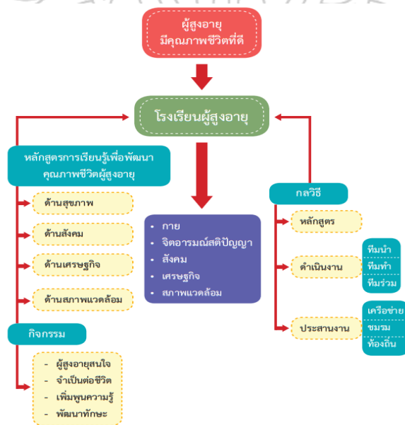
ภาพที่ 2.1 โครงสร้างโรงเรียนผู้สูงอายุ

ประกอบด้วย 4 กลุ่มวิชา คือ 1) ด้านสุขภาพ 2) ด้านสังคม 3) ด้านเศรษฐกิจ และ 4) ด้านสภาพแวดล้อม โดยอาจจัดจำนวนชั่วโมงที่เรียนตลอดหลักสูตร ควรเสนอไว้ดังนี้ 1) ระยะเวลาเรียน 3 เดือน เรียน 3 สัปดาห์ละ 1 วันๆ ละ 4 ชั่วโมง 2) เรียนไม่น้อยกว่า 48 ชั่วโมง แบ่งเป็นภาคทฤษฎี และภาคปฏิบัติ และ 3) ผู้เรียนไม่ควรเกินห้องละ 25 คน สำหรับการประเมินผล ใช้แบบทดสอบ ดูผลงาน วัดความพึงพอใจของผู้เรียน และไม่น้อยกว่าร้อยละ 50 โดยมีผลที่คาดหวัง คือ ผู้สูงอายุมีคุณภาพชีวิตที่ดีอยู่อย่างมีศักดิ์ศรี มีศักยภาพ พึ่งตนเองได้ สรุปลงแผนภาพที่