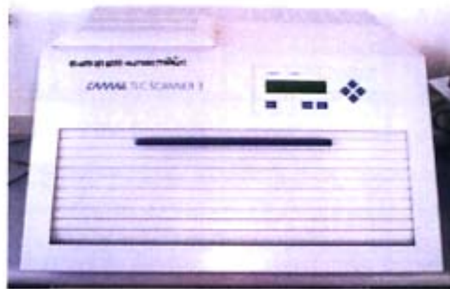
ภาพ 3.2 เครื่อง Manual TLC Scanner 3 ของบริษัท CAMAG