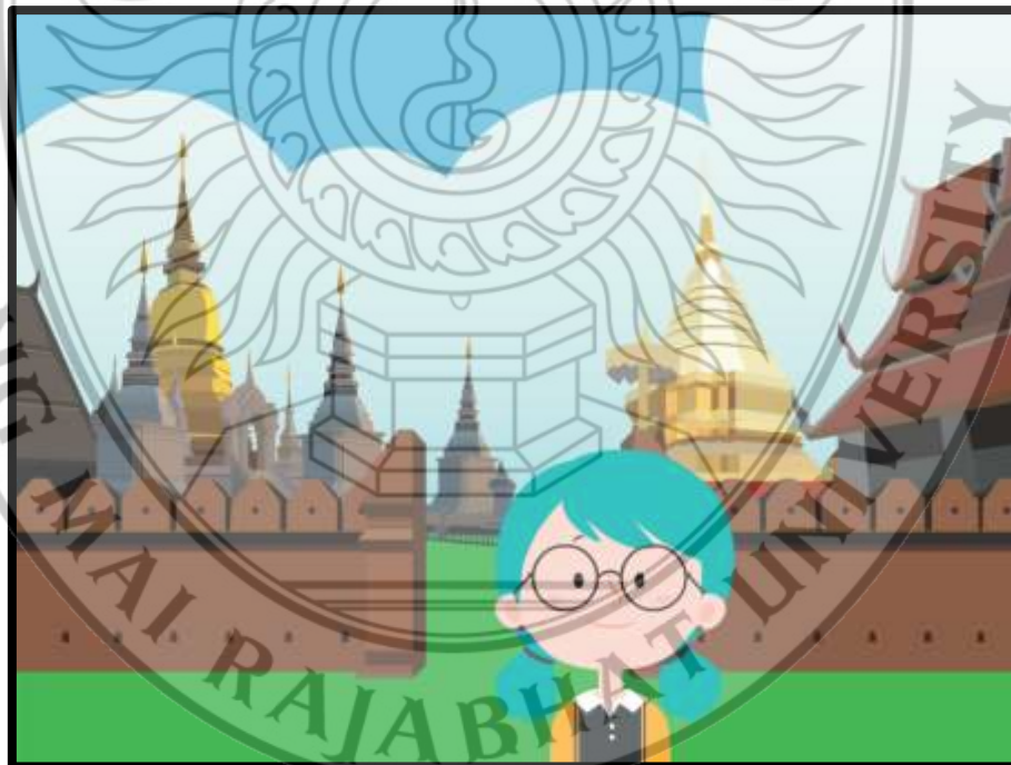
ภาพที่ 4.3 ฉากเกริ่นเรื่อง