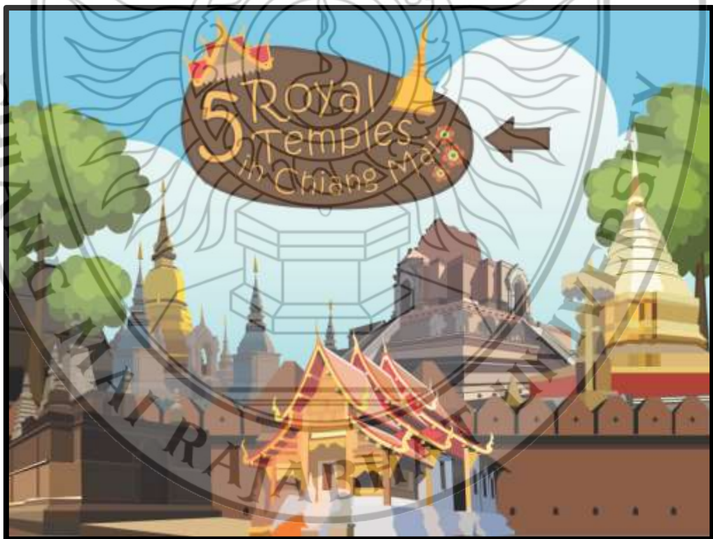
ภาพที่ 4.1 ฉากหน้าแรก

จากการพัฒนาสื่อด้วยกระบวนการพัฒนา 5 ขั้นตอน ซึ่งได้อธิบายไว้ในบทที่ 3 ทำให้ได้สื่อมัลติมีเดียในการนำเสนอข้อมูลเชิงประวัติศาสตร์ของแหล่งท่องเที่ยวในเมืองเชียงใหม่ มีการนำเสนอข้อมูล ดังนี้