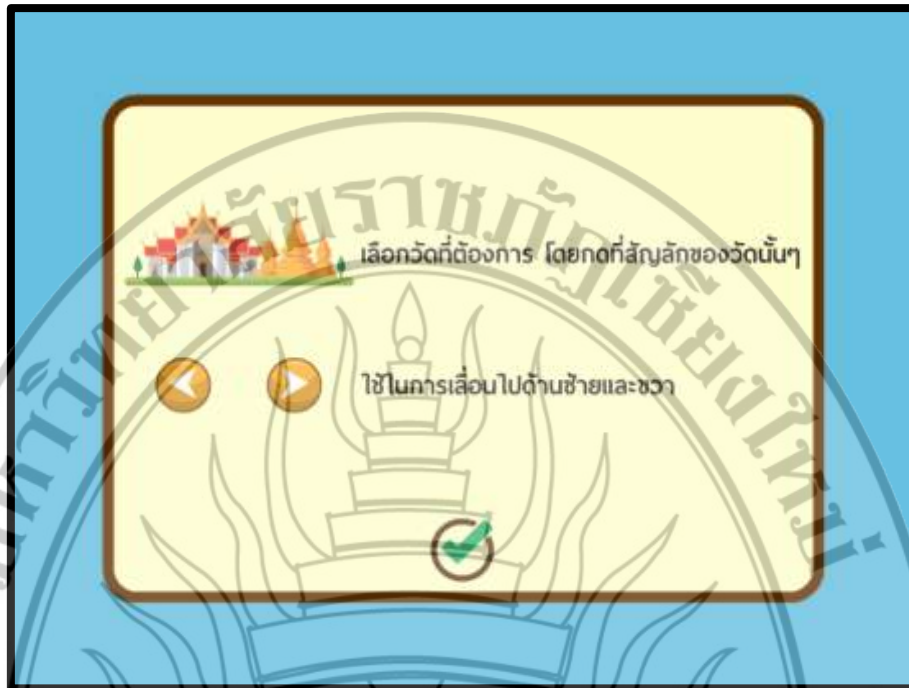
ภาพที่ 4.2 ฉากแนะนำโปรแกรม