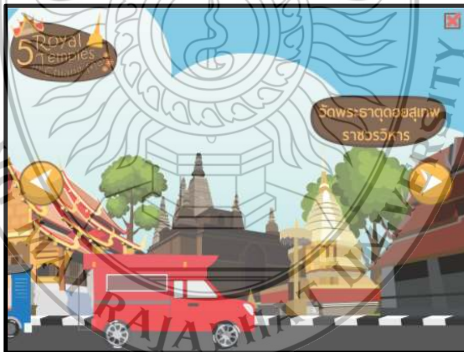
ภาพที่ 4.9 ฉากวัดพระธาตุดอยสุเทพราชวรวิหาร