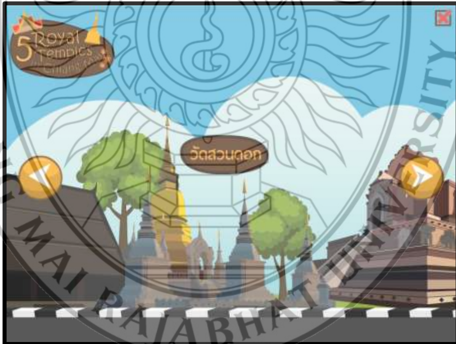
ภาพที่ 4.5 ฉากวัดสวนดอก