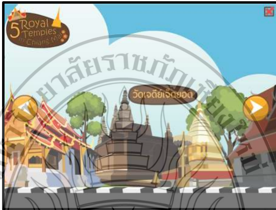
ภาพที่ 4.8 ฉากวัดเจ็ดยอด