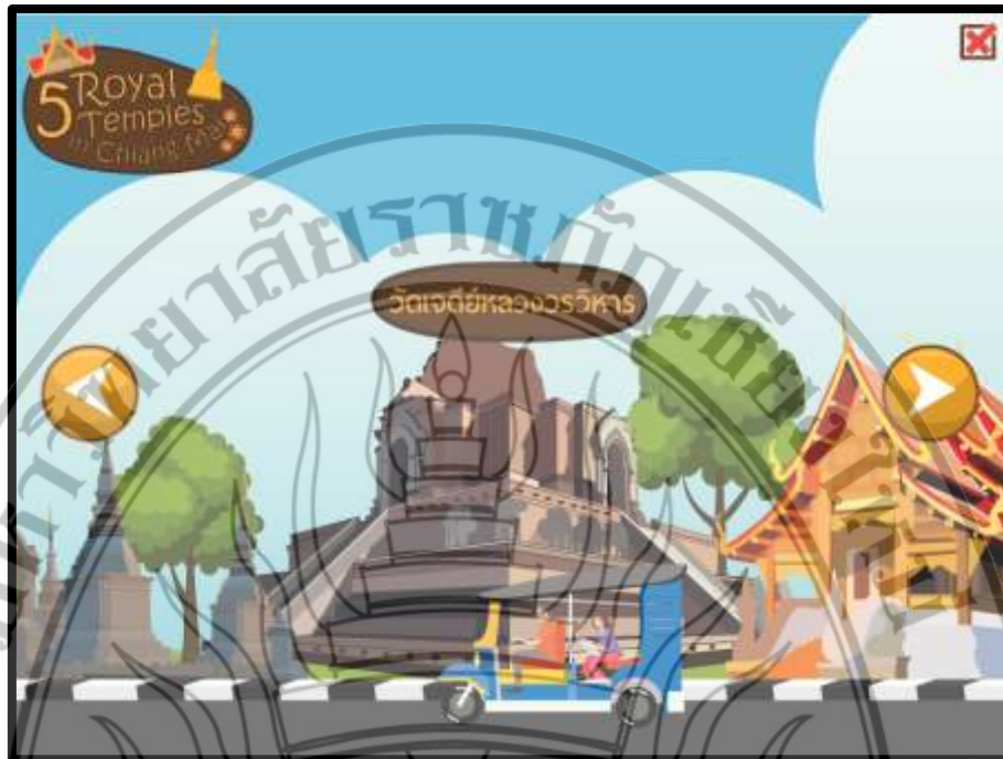
ภาพที่ 4.6 ฉากวัดเจดีย์หลวงวรวิหาร