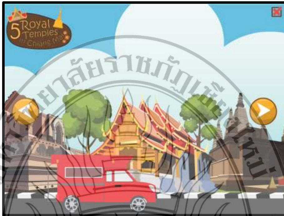
ภาพที่ 4.4 ฉากหน้าหลัก