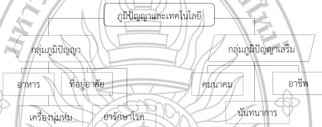
แผนภาพที่ 2.1 แสดงการแบ่งกลุ่มภูมิปัญญาท้องถิ่นตามปัจจัยสี่

วีระพงษ์ แสง-ชูโต (2544) ได้แบ่งกลุ่มภูมิปัญญาและเทคโนโลยีพื้นบ้านโดยอาศัยปัจจัย 4 เป็นแนวทางในการจัดกลุ่ม โดยแบ่งเป็นกลุ่มหลัก 4 กลุ่ม ได้แก่ อาหาร ที่อยู่อาศัย เครื่องนุ่งห่ม และยารักษาโรค และเป็นกลุ่มเสริมอีก 3 กลุ่ม ได้แก่ คมนาคม อาชีพ และนันทนาการ สามารถแสดงเป็นแผนภาพที่ 2.1 ดังนี้