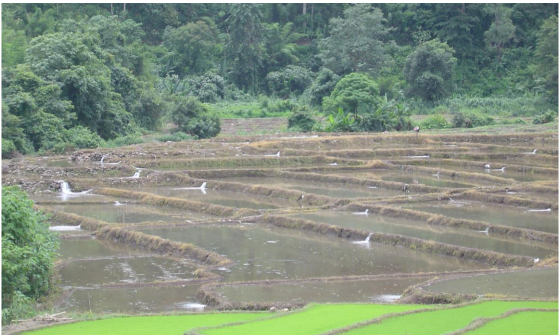
ภาพที่ 2.2 การดูแลลำน้ำและเทคนิคการปล่อยน้ำเข้านาตามลักษณะภูมิประเทศพื้นที่ลาดเอียงเชิงเขา

1. ภูมิปัญญาท้องถิ่นด้านการเกษตร หมายถึง การผสมผสานการเกษตรเทคโนโลยีโดยพัฒนาบนพื้นฐานดั้งเดิมซึ่งคนสามารถพึ่งพาตนเองในภาวะกรณีต่างๆได้ในเบื้องต้น เช่น การเกษตรกรรมแบบผสมผสานการแก้ไขปัญหามลพิษด้านการตลาด การแก้ไขปัญหาด้าน การผลิตการรู้จักปรับใช้เทคโนโลยี