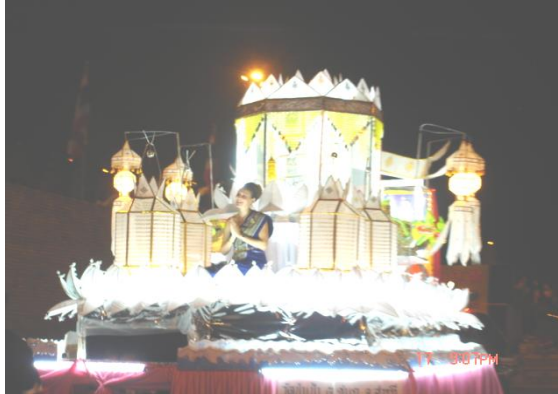
ภาพที่ 2.9 ประเพณียี่เป็ง การตกแต่งกระทงด้วยตุงและโคมแบบล้านนา ที่มา: ชไมমন ศรีสุรักษ์. 2550: ช่วงประตู่ท่าแพ อำเภอเมือง จังหวัดเชียงใหม่

ประเพณีมงคลของล้านนาในจังหวัดเชียงใหม่ มีรายละเอียดดังนี้