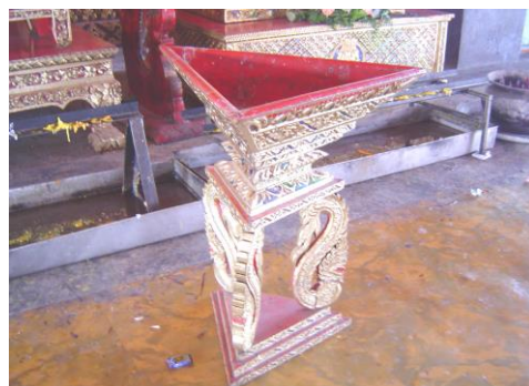
ภาพที่ 2.12 เครื่องสักการะ“ชั้นแก้วทั้งสาม” หมายถึง การบูชาพระรัตนไตร โดยวางกรวย

6.8 ศิลปวัฒนธรรมและประเพณีพิธีกรรมเกี่ยวกับเครื่องสักการะ เช่น สัตตภัณฑ์ หมายถึง การบูชาพระรัตนตรัย ทำโดยนักปราชญ์ช่างของล้านนา (สล่าล้านนา)