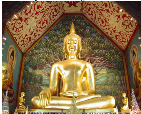
ภาพที่ 2.11 “พระเจ้าแก้วตื้อ” พระพุทธรูปที่สวยงามที่สุดในล้านนา

6.7 ภูมิปัญญาท้องถิ่นด้านศิลปวัฒนธรรมและประเพณีด้านพุทธศิลป์จังหวัดเชียงใหม่ มีพระพุทธรูปที่สวยงามที่สุดในล้านนา คือ “พระเจ้าแก้วตื้อ” ประดิษฐานที่วัดสวนดอก และ “พระเจ้าแตงคม” เป็นศิลปะอยู่ทอง ประดิษฐานที่วัดศรีเกิด