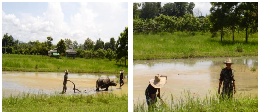
ภาพที่ 2.10 การทำนาแบบล้านนา

ที่มา: ชไมমন ศรีสุรักษ์. 2551: อำเภอแมริม จังหวัดเชียงใหม่