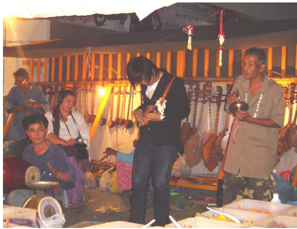
ภาพที่ 2.7 การแสดงดนตรีของกลุ่มศิลปินล้านนา

ที่มา: ชไมมน ศรีสุรักษ์. 2550: งานปิดถนนคนเดิน (Sunday market) อำเภอเมือง จังหวัดเชียงใหม่