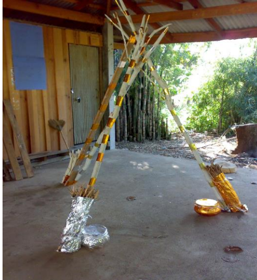
ภาพที่ 2.3 ไม้งาม หรือไม้ค้ำข้าว อุปกรณ์ที่ใช้ประกอบพิธีกรรมการสืบชะตาน้ำเพื่อจัดการทรัพยากรธรรมชาติและสิ่งแวดล้อม

2. ภูมิปัญญาท้องถิ่นด้านการจัดการทรัพยากรธรรมชาติและสิ่งแวดล้อม หมายถึง การอนุรักษ์ทั้งด้านธรรมชาติและศิลปวัฒนธรรม การอนุรักษ์ป่าไม้ ต้นน้ำลำธารการรักษา และถ่ายทอดความรู้ดั้งเดิมเพื่อการอนุรักษ์