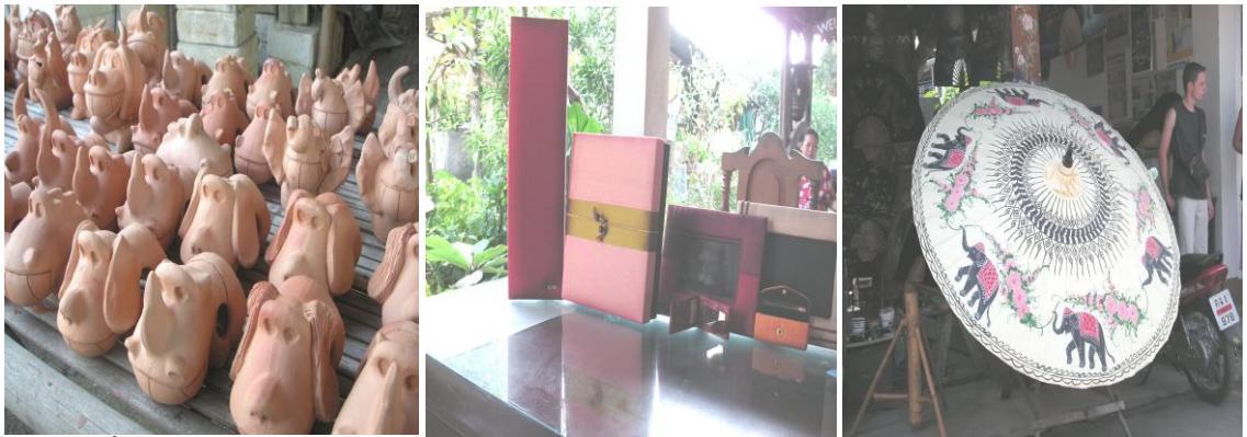
ภาพที่ 2.6 ภูมิปัญญาการผลิตแปรรูปหัตถกรรมท้องถิ่นเพื่อชุมชนพึ่งตนเองทางเศรษฐกิจ

5. ภูมิปัญญาท้องถิ่นด้านการผลิตและบริโภค หมายถึง การรู้จักประยุกต์ใช้เทคโนโลยีสมัยใหม่ในการแปรรูปผลผลิต เพื่อการบริโภคอย่างปลอดภัย ประหยัด และเป็นธรรมชาติอันเป็นกระบวนการให้ชุมชนท้องถิ่นสามารถพึ่งตนเอง แก้ไขเศรษฐกิจและชะลอการนำเข้าตลาด