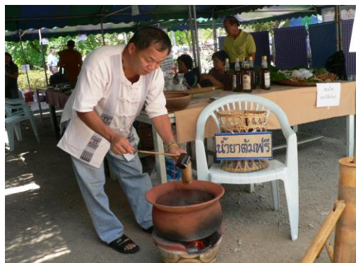
ภาพที่ 2.4 ยาต้มสมุนไพร “มะไฮกเลือด” แก้วปวดหัว

4. ภูมิปัญญาท้องถิ่นด้านการรักษาโรคและป้องกัน หมายถึง การสืบทอดความรู้ดั้งเดิมและรู้จักประยุกต์ความเชื่อท้องถิ่น เพื่อให้ชุมชนสามารถพึ่งตนเองได้ทางด้านสุขภาพอนามัย