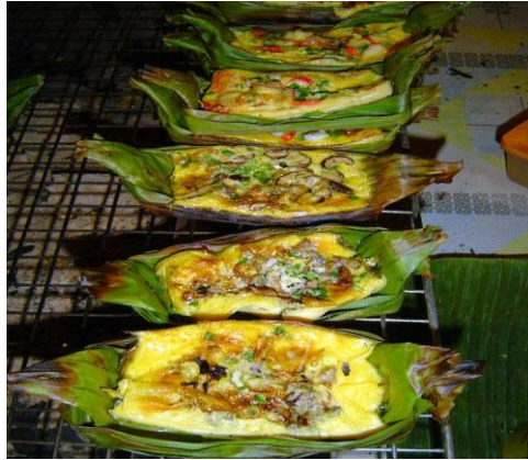
ภาพที่ 2.5 ไข่ปามอาหารที่มีผักสมุนไพร